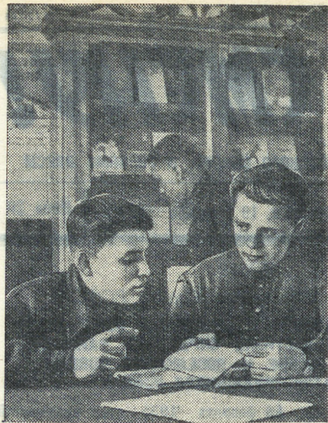
Камышловская школа механизации сельского хозяйства готовит большую группу трактористов. Весной свыше ста новых специалистов, окончивших эту школу, поедут работать на целинные земли.