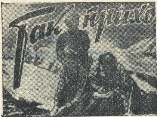
НА ПИКЕ «БУРЕВЕСТНИК»