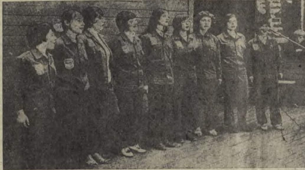
12 августа в парке культуры и отдыха поселка Быстринский строители праздновали день своей профессии. Хороший концерт подготовили к Дню строителя самодеятельные артисты. Одним из номеров программы было выступление девушек из студенческого отряда «Эдельвейс» Свердловского лесотехнического института.

Г. ЧЕПЧУГОВ, начальник лесопильного цеха.