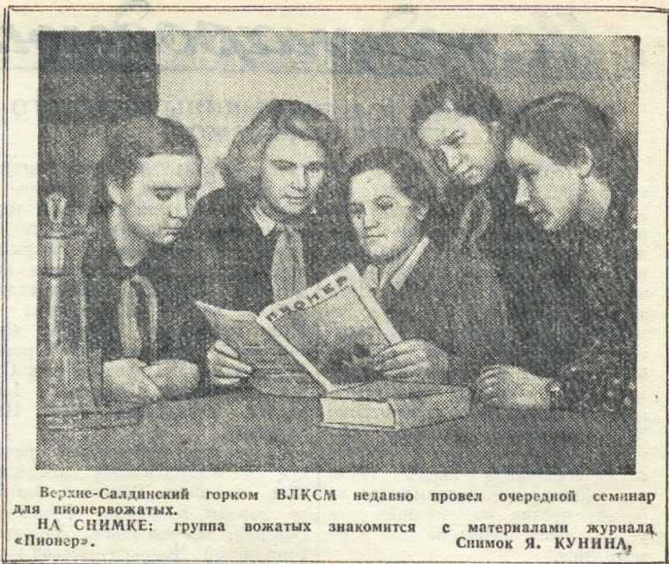
Верхне-Салдинский горком ВЛКСМ недавно провел очередной семинар для пионервожатых. НА СНИМКЕ: группа вожатых знакомится с материалами журнала «Пионер».