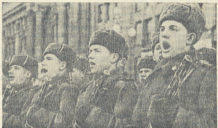
Октябрьский парад в Свердловске.