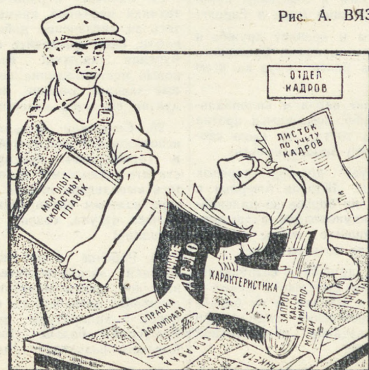
Рис. А. ВЯЗНИКОВА.

★ Боясь спокойствие нарушить, Столкнуться с жизнью носом в нос, Он завернет любую душу Коль не в анкету, так в запрос. ★