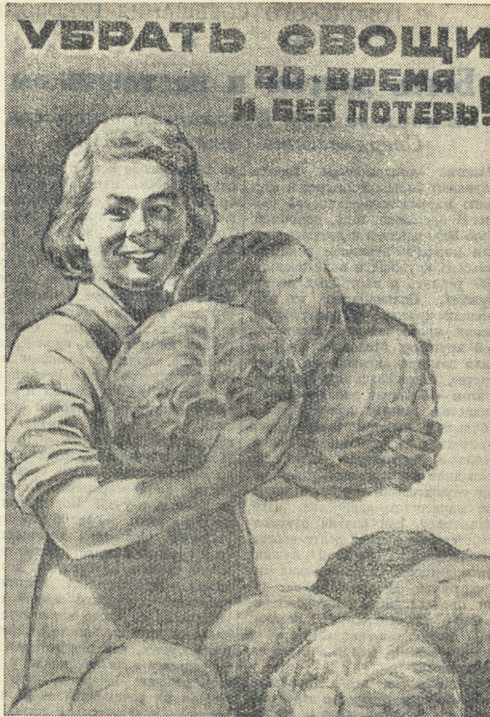
Плакат художника А. ВЯЗНИКОВА.