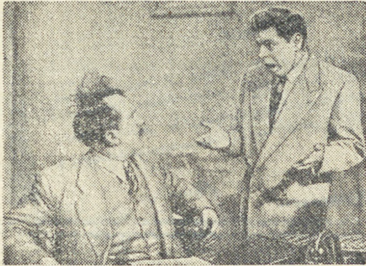
Кадр из фильма.

*) Сценарий В. Полякова, постановка Н. Досталь, засл. арт. РСФСР А. Тутышкина.