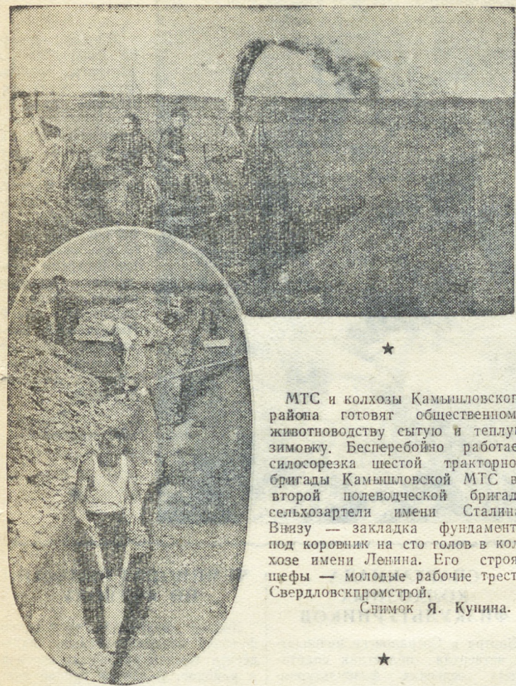
МТС и колхозы Камышловского района готовят общественному животноводству сытую и теплую зимовку. Бесперебойно работает силосорезка шестой тракторной бригады Камышловской МТС во второй полеводческой бригаде сельхозартели имени Сталина. Визу — закладка фундамента под коровник на сто голов в колхозе имени Ленина. Его строят шефы — молодые рабочие треста Свердловскпромстрой.