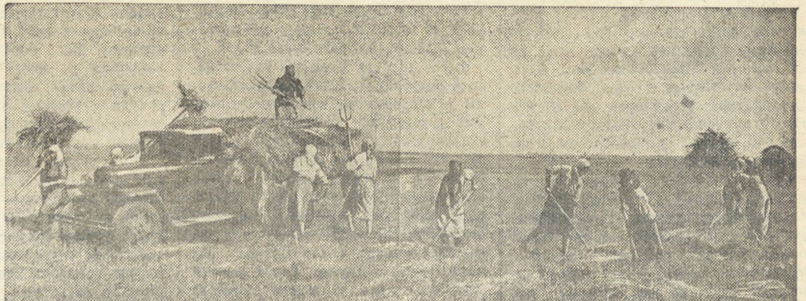
В Камышловском колхозе имени Ленина в разгаре заготовка кормов. В этом году здесь будет заложено четыре тысячи тонн силоса — в два раза больше, чем в 1953 году. Каждая кова получит по семь тонн силоса! Сытую зимовку готовят общественному животноводству камышловские колхозники.