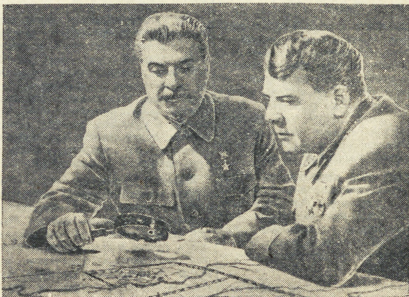
Кадр из кинофильма «Сталинградская битва».

В роли Верховного Главнокомандующего И. В. Сталина снимался народный артист РСФСР А. Дикий. Он хорошо справился со своей исключительно сложной задачей. Артист сумел каждым движением, каждым словом передать обязатель-