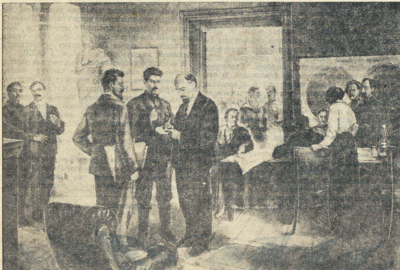
НА АПРЕЛЬСКОЙ КОНФЕРЕНЦИИ (1917).