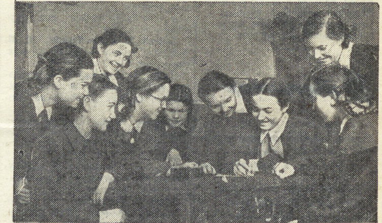
Учащиеся 8 класса «а» средней школы №1 Кировграда ведут систематическую переписку с болгарскими пионерами. НА СНИМКЕ: пионеры пишут письмо своим болгарским друзьям.

ОТ РЕДАКЦИИ: Вопрос, затронутый в письме Н. Краснокутской, волнует многих юношей и девушек, Светлое и большое чувство — любовь многие подчас понимают неправильно. Поэтому и возникают взгляды и суждения, о которых рассказывает письмо. Каким же должно быть настоящее чувство, помогающее человеку жить и работать, украшающее его жизнь? Редакция просит читателей газеты высказать свое мнение по этому поводу.