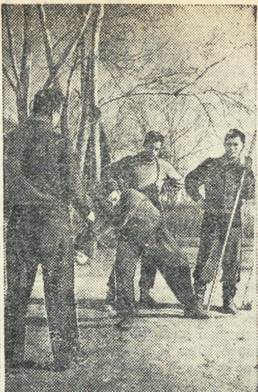
Легкоатлеты готовятся к первым состязаниям. НА СНИМКЕ: студенты горного института тренируются в толкании ядра.

Настало время, садовод, Густую зелень разнимая, Увидел, кажется, не плод, А золотое солнце мая.