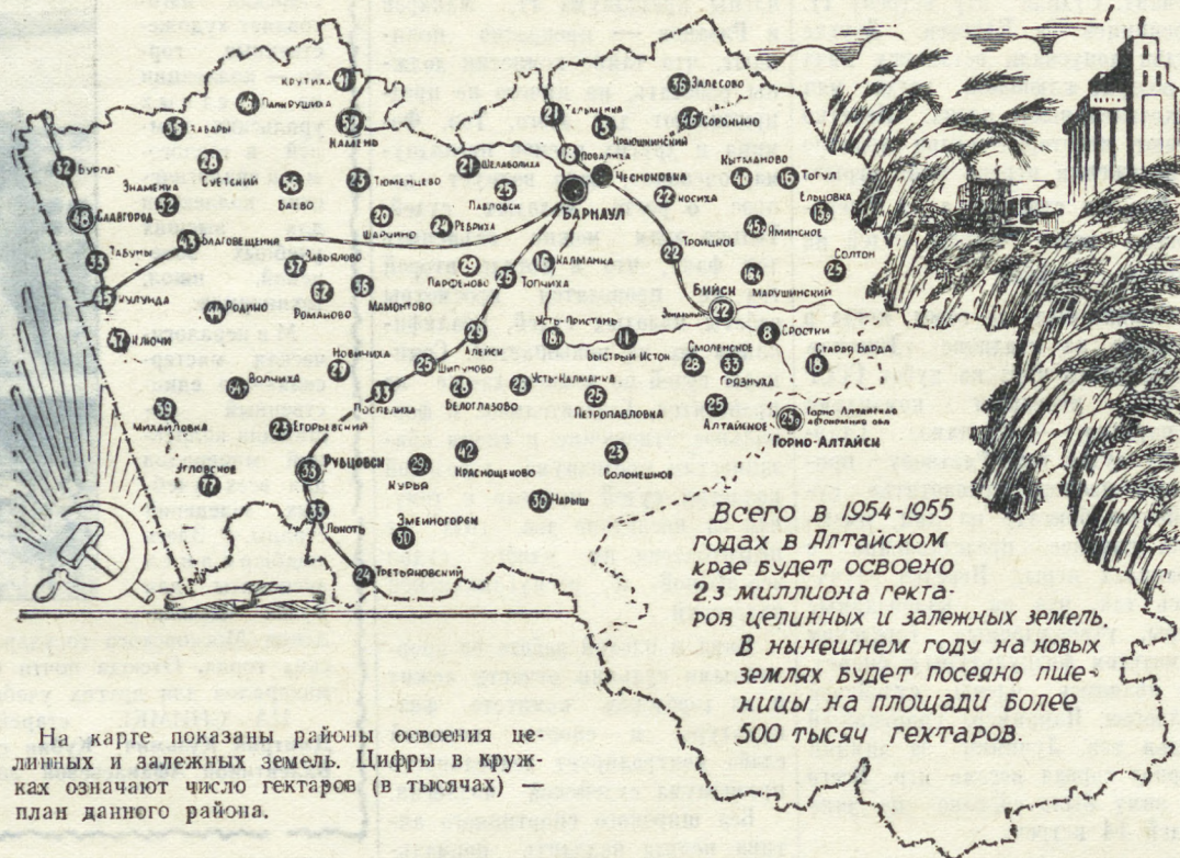
На карте показаны районы освоения целинных и залежных земель. Цифры в кружках означают число гектаров (в тысячах) — план данного района.

О том, что представляет из себя Алтайский край, где начала свой новый трудовой путь большая группа уральских комсомольцев, и рассказывается на этой странице.