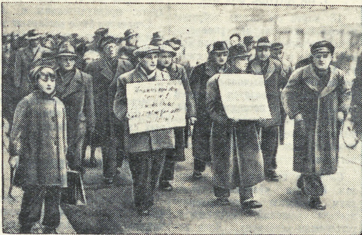
В американском секторе Западного Берлина состоялась демонстрация западногерманских безработных. Они протестовали против высоких цен, против увольнений и против милитаризации страны. Полиция напала на демонстрантов с дубинками.

Многочисленные выступления против создания «Европейского оборонительного сообщества» происходят ежедневно в Западной Германии. В Дюссельдорфе состоялась конференция представителей западногерманской общественности, выступающих против боннского и парижского военных договоров и требующих заключения мирного договора с Германией. В принятом конференцией обращении к немцам указывается, что создание «Европейского оборонительного сообщества» исключает возможность восстановления единства Германии. Решительно осудила план «Европейского оборонительного сообщества» конференция западногерманского профсоюза строителей рабочих, объединяющего 10 тысяч человек. Конференция призвала объединение профсоюзов Западной Германии выступить против военных планов боннской клики и ее американских хозяев. Этот призыв прозвучал тем более своевременно, что боннский канцлер Аде-