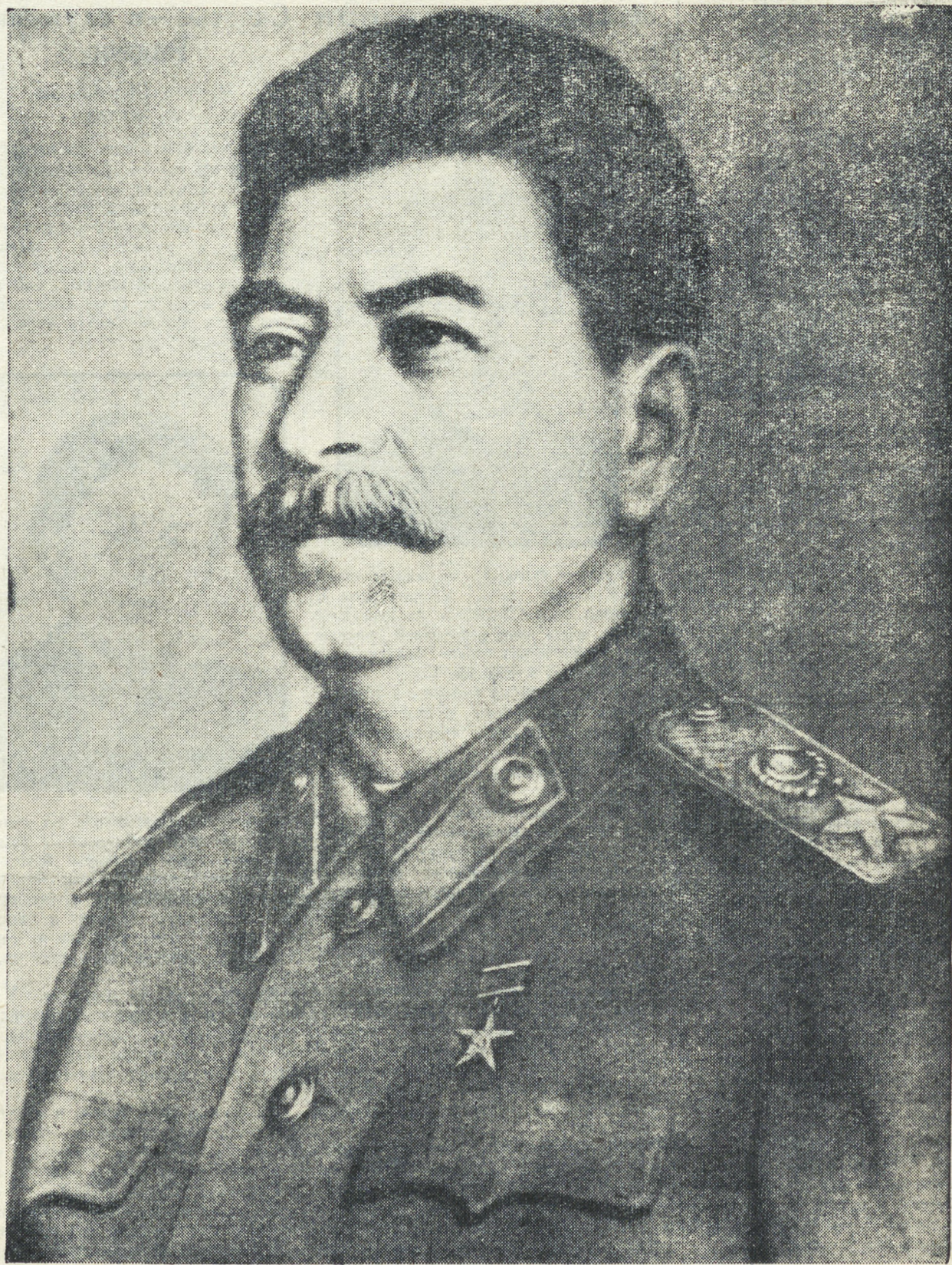
Творец самой демократической Конституции в мире — Великий Сталин

Радостна жизнь молодежи, ибо ей нечего бояться завтрашнего дня. Она в нем уверена. Она знает, что завтра жизнь будет еще лучше, чем сегодня. Поручкой в этом — героический путь, пройденный нашей страной под руководством великой партии большевиков. Поручкой в этом — гений Сталина!