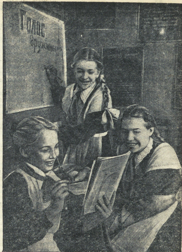
ЗА ВЫПУСКОМ СТЕНГАЗЕТЫ.

— Эх ты! Заячья душа, — скривил губы Оросутцев. — Чего полез туда? Стучался кто что ли? (Продолжение следует).