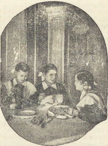
В детском доме Малого Истока Арамилского района.

В прошлое воскресенье в новом доме по улице Водопроводной, 1 открылся новый, хорошо оборудованный промтоварный магазин. Покупателям предложен большой выбор шерстяных и хлопчатобумажных тканей, трикотажных изделий, обуви, хозяйственных товаров, мебели, галантерей и парфюмерии. Выручка за первый день торговли составила 75 тысяч рублей.