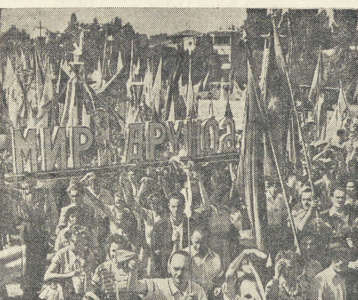
Бухарест. IV Всемирный фестиваль молодежи и студентов за мир и дружбу. На площади имени Сталина состоялась демонстрация румынской молодежи, посвященная фестивалю. В ней приняло участие 30000 человек.