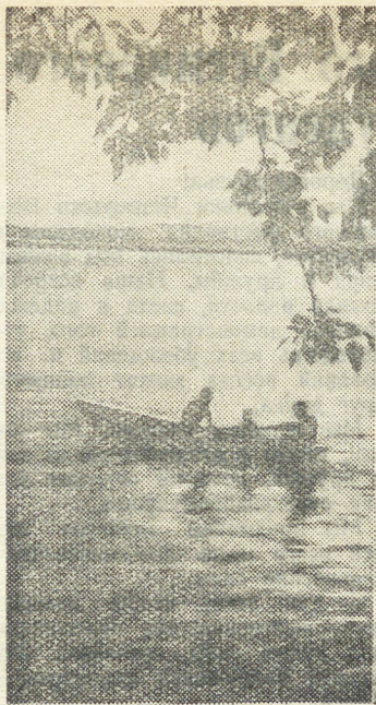
ВЕЧЕР НА РЕКЕ

Сейчас все инструкторы утверждены на бюро райкома. Для них будет проведен семинар — совещание по вопросам практики комсомольской работы.