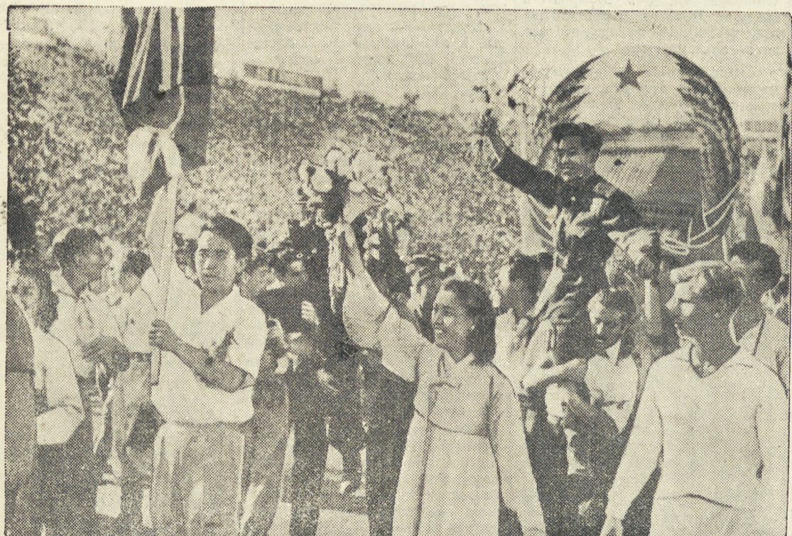
Бухарест. Открытие IV Всемирного фестиваля молодежи и студентов за мир и дружбу. На стадионе имени 23 августа состоялся парад посланцев молодежи, прибывших из 106 стран мира. На снимке: делегация Кореи на параде.

За справками обращаться по адресу: г. Свердловск, ул. им. Ленина, 24, 5й этаж, школьный сектор горсовета, телефон Д1-25-12.