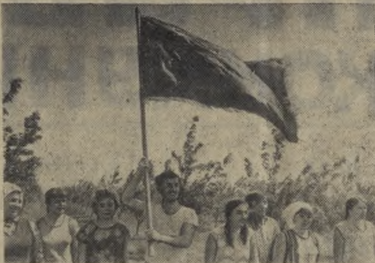
Молдавская ССР. Всесоюзная ударная комсомольская стройка. Мы привыкли, что за этими словами — возведение плотины мощной электростанции, строительство крупного завода, железнодорожной линии.

А здесь — сад. Сад-гигант, протянувшийся от Тирасполя до границы с Украиной на 30 километров.