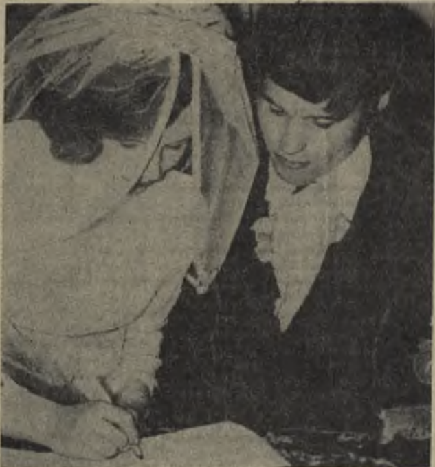
СОВЕТ ДА ЛЮБОВЬ.