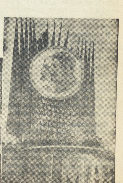
Парад и демонстрация в Свердловске.