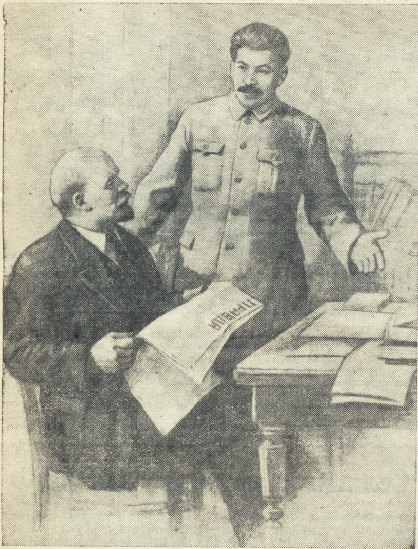
В. И. Ленин и И. В. Сталин.