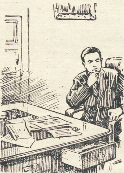
...На столе Гюберта лежали различные бумаги, заметки, шифрованные телеграммы.

...Чем бы я ни занимался, о чем бы ни думал в эти последние дни, мысли постоянно возвращались к Куркову. Все шло гладко и ничто не вызвало тревоги, но я ожидал, что вот-вот Гюберт потребует меня к себе и попросит уточнить биографические несоответствия. Фома Филимоныч заметил мое тревожное состояние. Это плохо: заметил друг — могут заметить и враги. Пришлось поделиться с Фомой Филимонычем своими опасениями. Он потеревил кудлатую бороденку,