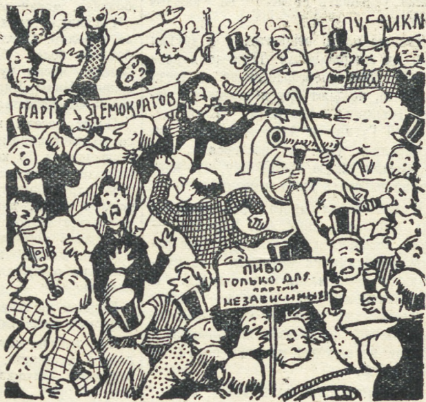
..Случайные стычки между застрельщиками обеих партий оживляли приготовления..

Шум и суета, возвестившие о наступлении утра, могли вытеснить из головы самого романтичного мечтателя в мире все ассоциации, кроме тех, которые непосредственно связывались с быстрой и близившейся выборами. Бой барабанов, звуки рожков и труб, крики людей и топот лошадей гудко проносились вдоль улиц с самого рассвета; а случайные стычки между застрельщиками обеих партий оживляли приготовления и вместе с тем приятно их разнообразили.