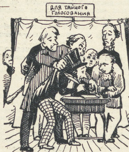
..Голосование, конечно, считалось тайным..

Наконец, наступил великий день, день выборов, который, как всем известно, увенчал политическую карьеру мистера Смита. Нет необходимости пространно говорить об этом, потому что это уже принадлежит истории. Действуя по указанию, больше всего воздерживались от голосования в ранние часы сторонники мистера Смита. Мистер Смит полагал, что голосование должно производиться по тому же плану, как и охота на медведей. — Придержите свои голоса, ребята, — говорил он, — не горячитесь. Подождите, пока не разгорятся страсти, вот тогда и навалитесь со своими голосами! В каждом избирательном участке в Мариополе находились чиновник и два поверщика, наблюдавшие за порядком, и избиратели осторожно заглядывали в помещение, как мышь в ловушку, и боя-