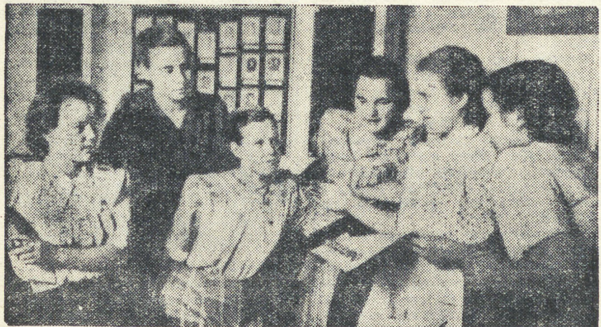
Комсомолки беседуют об открытии Волго-Донского судоходного канала.