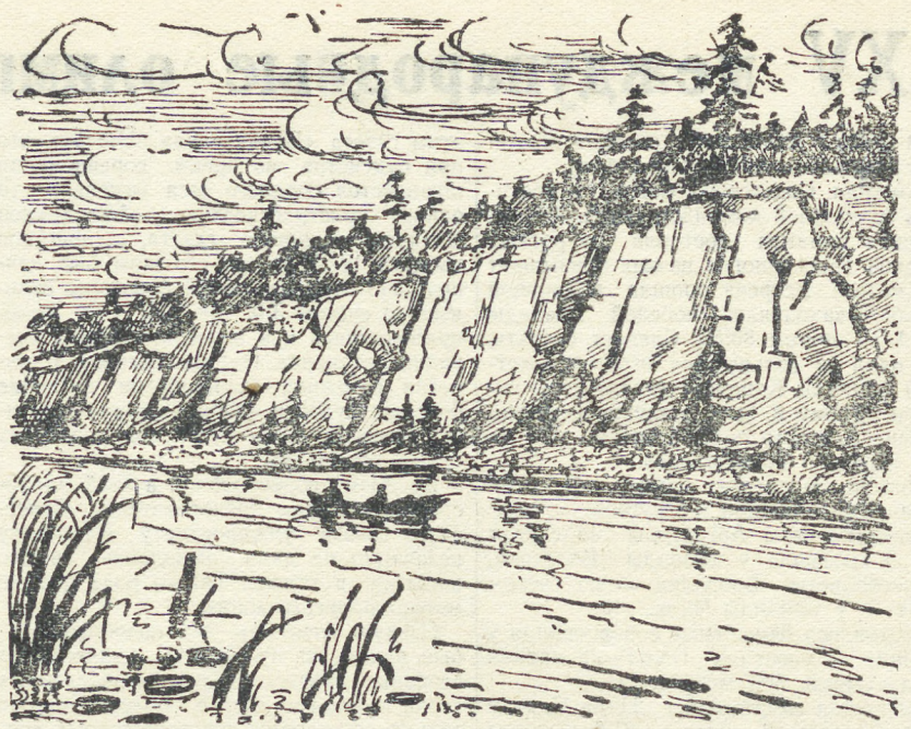
Летом на реке Чусовой.