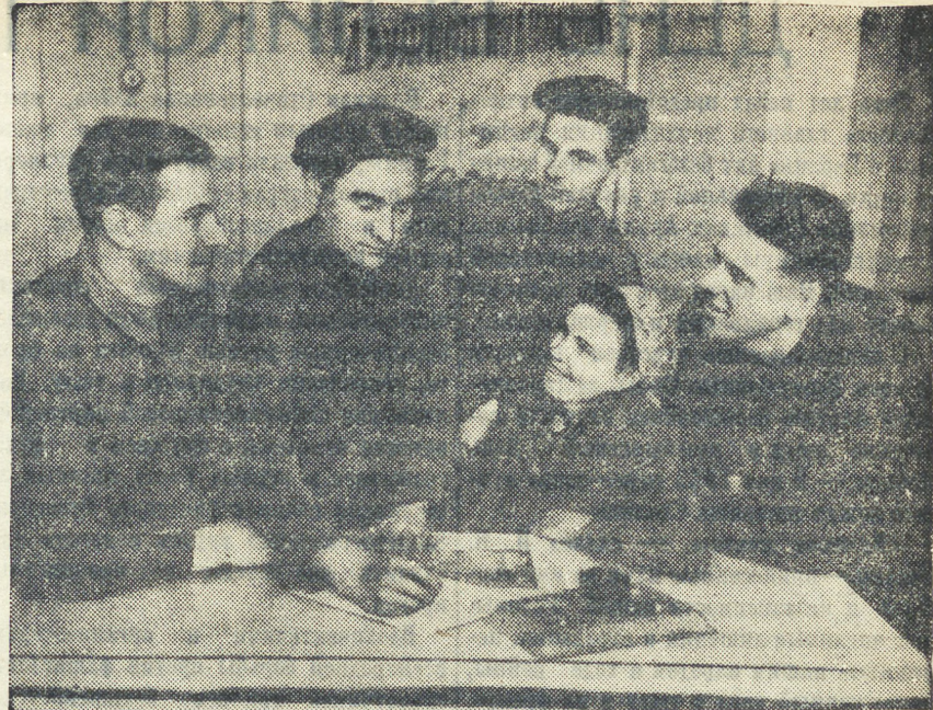
Молодежь Уралмашзавода с огромным подъемом встретила сообщение о выпуске нового займа. Она горячо приветствует постановление правительства и с радостью отдает взаимно государству свои сбережения.