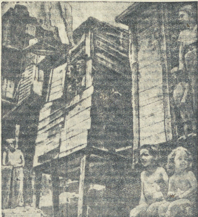
НА СНИМКЕ: трущобы, в которых живут рабочие плантаций со своими семьями.

Первое и второе места в турнире поделили советские шахматисты Тайманов и Бронштейн, набравшие по 6,5 очка из 7 возможных. На третьем месте представитель финских студентов Пастухов, набравший 3,5 очка. Четвертое, пятое и шестое места поделили набравшие по 3 очка чемпионы среди английских студентов Мардл, финские шахматисты Нирен и Рутанен. На седьмом месте датчанин Крауб-Динсен и на восьмом — индийский студент Катрагатта.