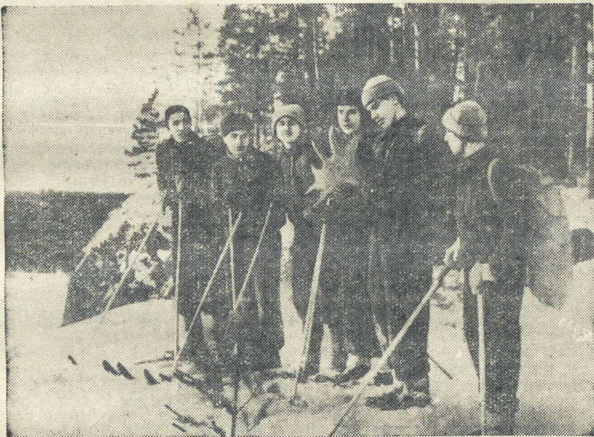
Туристы рассматривают рог лося, найденный в районе «Денежкин камень».

В молодежном интернате третьего Северного бокситового рудника и в интернате № 1 треста Бокситстрой они провели несколько бесед на тему: «Физкультурное движение в СССР». Затем, не задерживаясь долго на отдыхе, взяли курс на восток. Шли сначала по за-