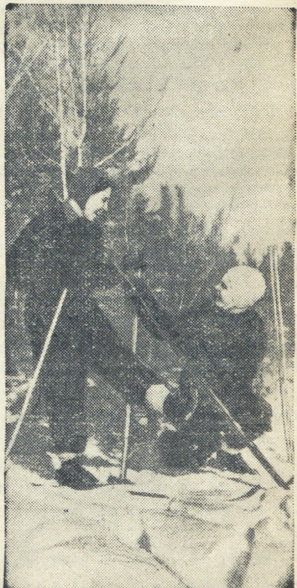
НА ПРОГУЛКЕ.