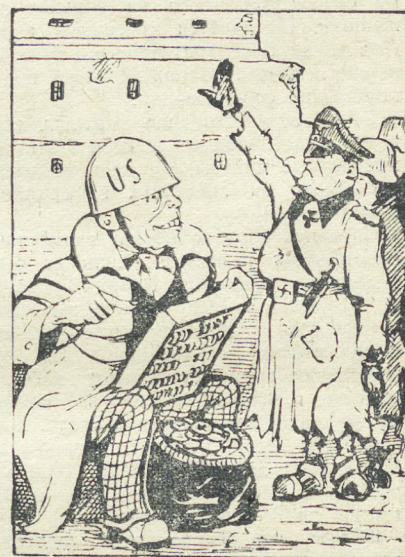
Новоявленный американский Чичиков.

Путь правительства Трумэна отмечен одним убийством, двумя самоубийствами, 19 осуждениями, 11 случаями ухода в отставку в связи с разоблачением, 137 увольнениями за злоупотребления, наличием 200 тысяч бездельников, получающих жалование.