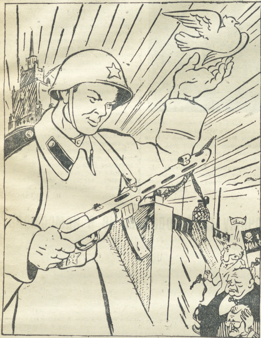
Рис. Л. МАКОВКИНА.