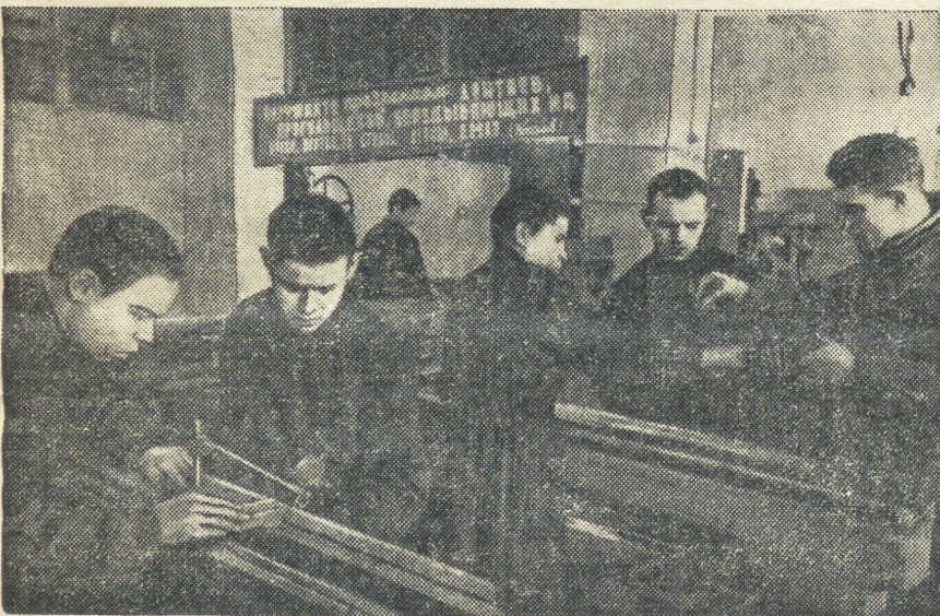
Учащиеся Свердловского ремесленного училища № 18 изготавливают собственными силами совершенные токарные станки для колхозов и машинно-тракторных станций. В прошлом году они сделали 200 станков, с начала этого учебного года — уже 60.