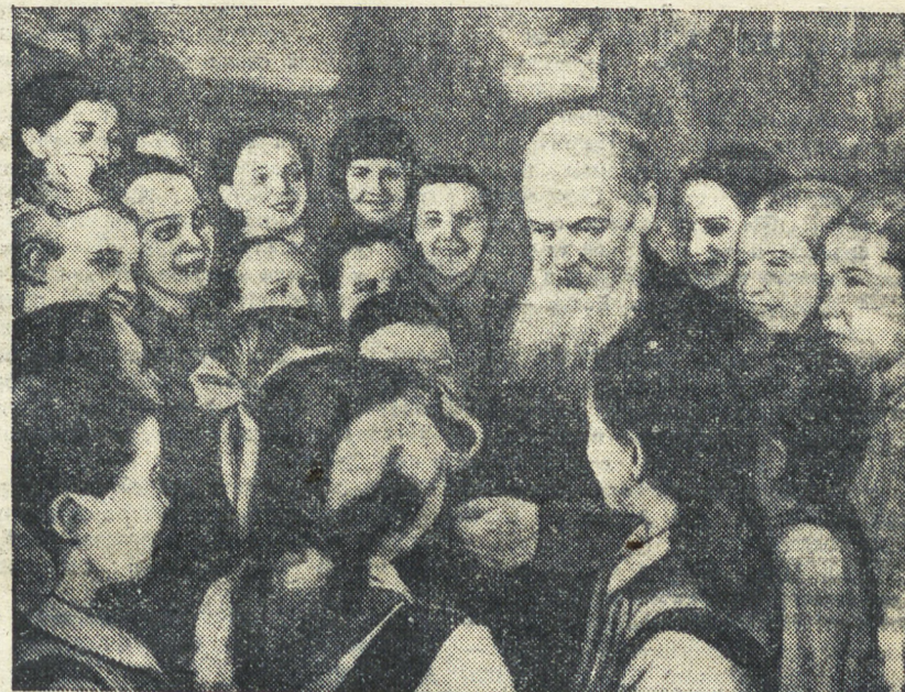
Павел Петрович Бажов — один из любимейших писателей советской детворы. Часто встречался он с юными читателями — пионерами и школьниками Свердловска.

НА СНИМКЕ: Павел Петрович Бажов на встрече с пионерами в Свердловском Дворце пионеров и школьников. Снимок сделан в августе 1950 года.