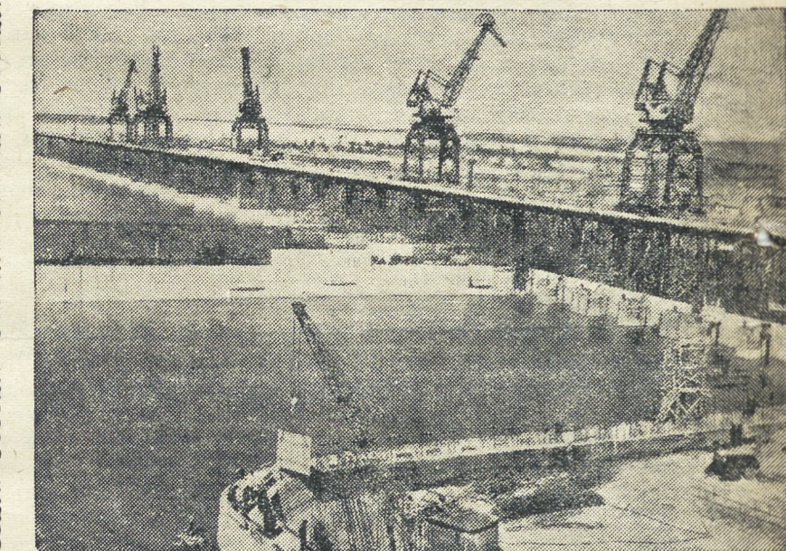
На строительстве Цимлянского гидроузла. Дон пошел по новому руслу через гидротехнические сооружения. НА СНИМКЕ: общий вид котлована, наполненного водами Дона.

Сталинград: — Спасибо. От имени молодых сталинградцев и строителей передайте горячий комсомольский привет молодежи Урала.