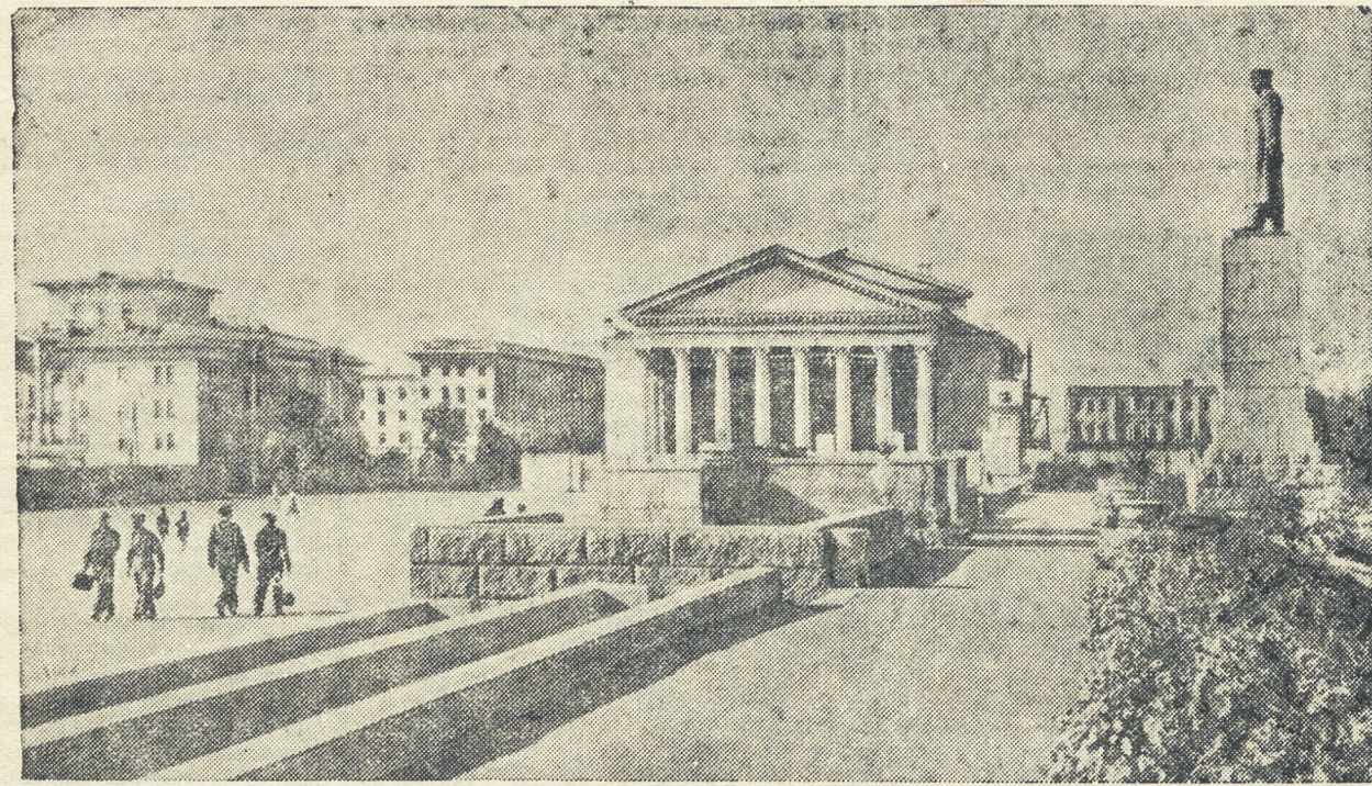
Сталинград. Он стал символом величия и мужества советских людей, дважды отстоявших от врагов первое в мире социалистическое государство. Любимо восстанавливает советский народ этот город-герой. НА СНИМКЕ: одна из площадей Сталинграда — Площадь Павших Борцов.