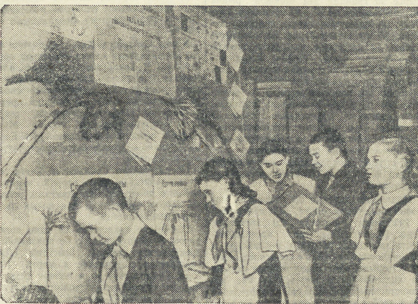
К отчетно-выборному сбору дружины пионеры школы № 2 Свердловска подготовили содержательную выставку, рассказывающую о работе школьников в прошлом учебном году и летом.

НА СНИМКЕ: пионеры школы у стенда кружка юннатов.