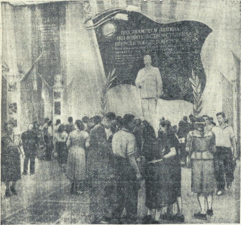
На Всемирном фестивале открыта выставка «Советская молодежь в борьбе за мир». В залах выставки размещены фотографии, картины, показывающие мирный труд, учебу и достижения советской молодежи. В двух залах выставлены произведения советской живописи и скульптуры.

НА СНИМКЕ: посетители в одном из залов выставки.