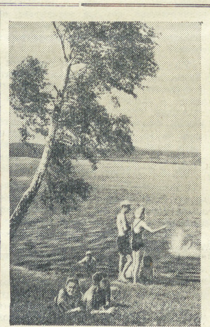
На пляже в воскресный день.

Те из участников, чьи модели показали в этих состязаниях хорошие результаты, в составе сборной команды области будут участвовать во всесоюзных соревнованиях моделлистов в Москве.