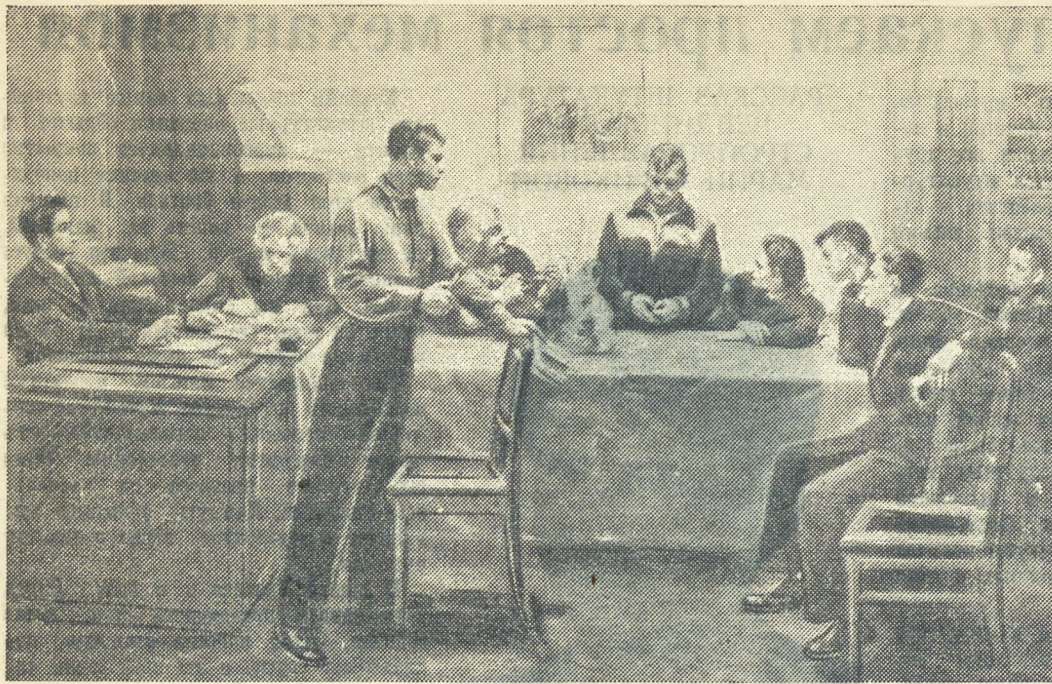
Картина художника С. А. Григорьева «Обсуждение двойки». (Фотохудожник ТАСС).

«Вы совершили все, что подобало совершить великому таланту... — писал Гончаров, — литературе Вы принесли в дар целую библиотеку художественных произведений, для сцены создали свой особый мир. Вы один достроили здание, в основание которого положили краеугольные камни Фонвизин, Грибоедов, Гоголь. Но только после Вас мы, русские, можем с гордостью сказать: «у нас есть свой русский, национальный театр. Он по справедливости должен называться: «Театр Островского».