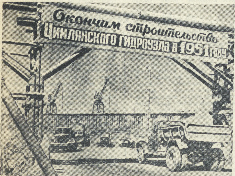
Одним из основных сооружений Волго-Донского канала является Цимлянский гидроузел. Он будет состоять из двух плотин и гидростанции. Здесь развернулись грандиозные работы. Сооружается плотина в 13 с половиной километров длины.