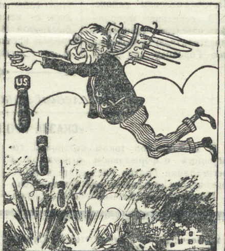
Рис. читателя Е. Цуканова.

(Из передовой газеты «Правда» за 18 апреля 1951 г.)