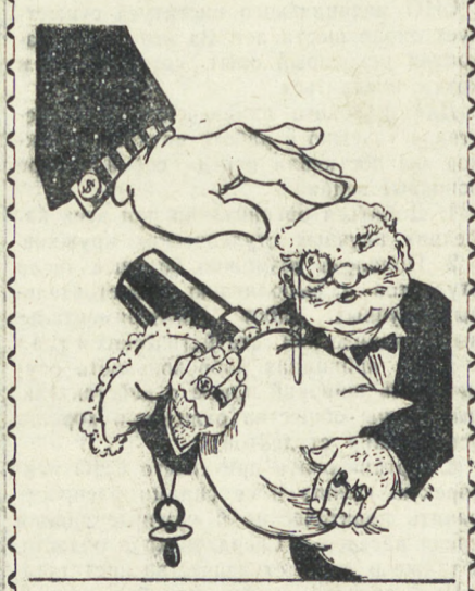
Рис. П. Евладова. Что дядя Сам зверей зверее, Тому свидетельство — Корея. И подозрительно усердые, Коль он зовет к милосердию. Убийц прощает ныне дядя: Вновь на свободе пушечный король... Помилован! Чего же ради Гуманность, и не к месту столь, Откуда милость вдруг такая? Понять легко — ясное дню, Что Крупп — всяк в заморской стае И дяде кровная, верней сказать, Кровавая родня!