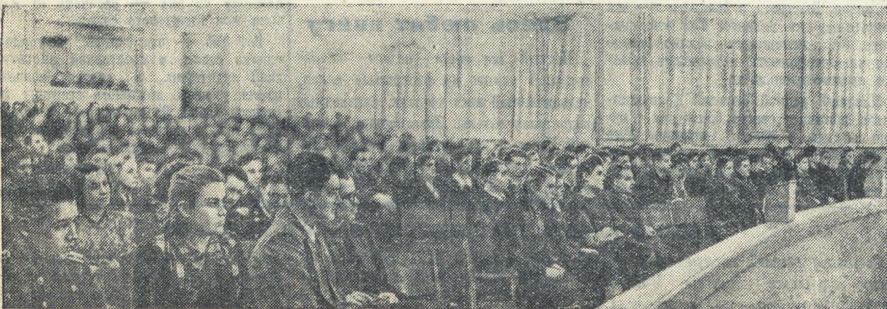
В зале заседаний конференции.

Хочется пожелать новому составу горкома комсомола, его физкультурному отделу обратить особое внимание на подбор и воспитание кадров физкультурных работников и шире развернуть воспитательную работу среди спортсменов.