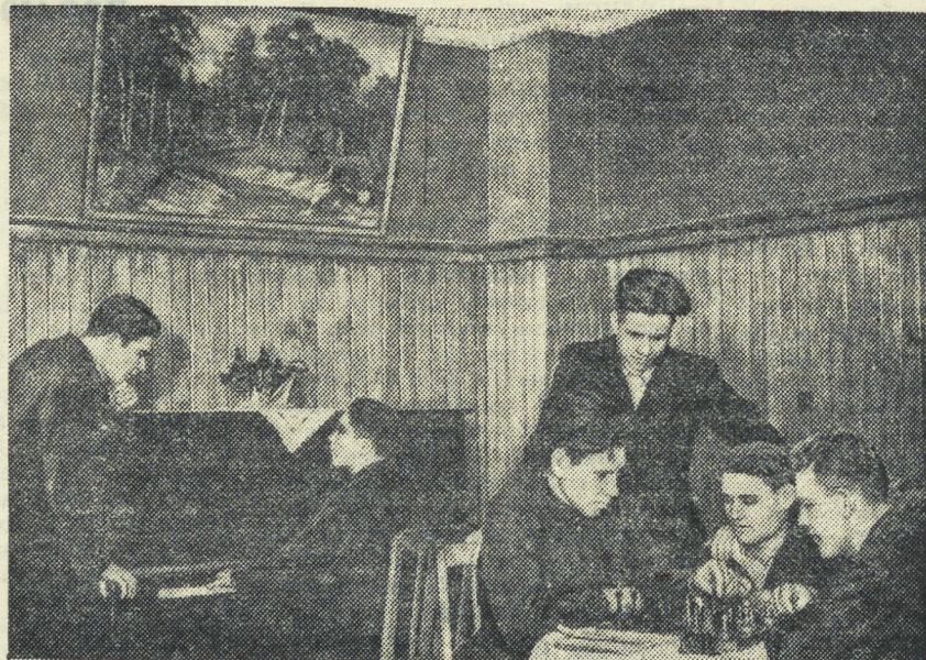
Вечером в красном уголке.

лого есть какое-нибудь общественное поручение.