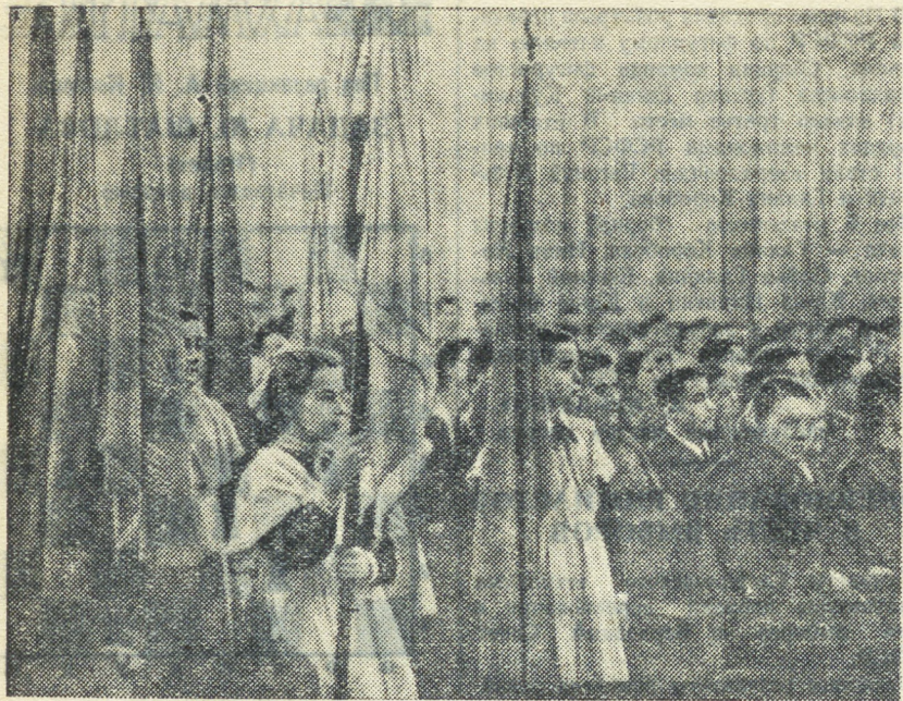
Пионеры приветствуют конференцию.