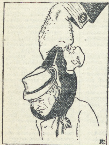
Рис. П. Евладова.

Лейборист, премьер сэр Эттли На народной шее — петля! И. ТАРАБУКИН.