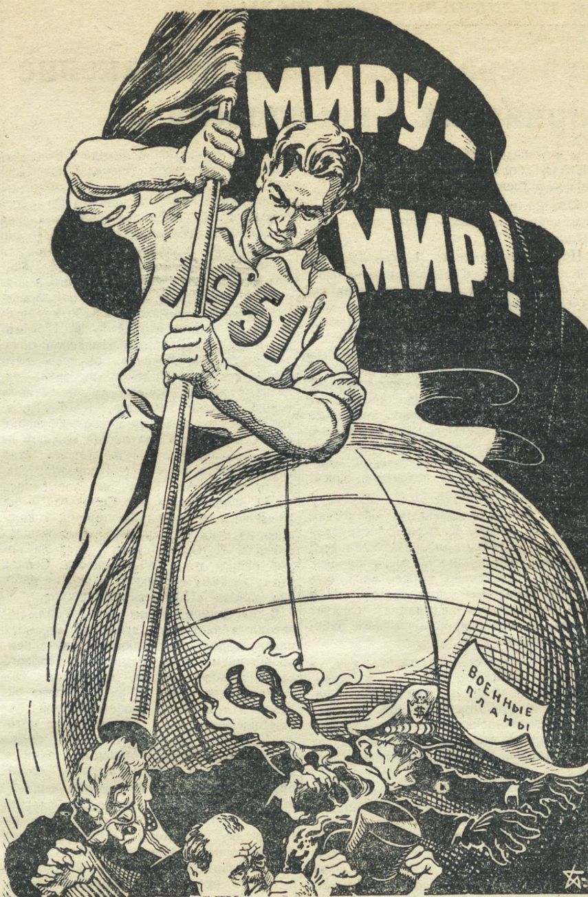
Рис. П. ЕВЛАДОВА.