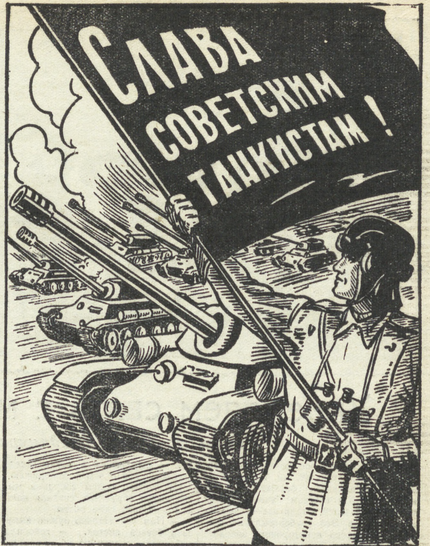
Рис. Б. Голомидова.

Советские бронетанковые и механизированные войска зародились в 1918 году в период организационного оформления Красной Армии. Под непосредственным руководством В. И. Ленина и И. В. Сталина было положено начало отечественному танкостроению и заложены основы развития бронетанковых и механизированных войск.