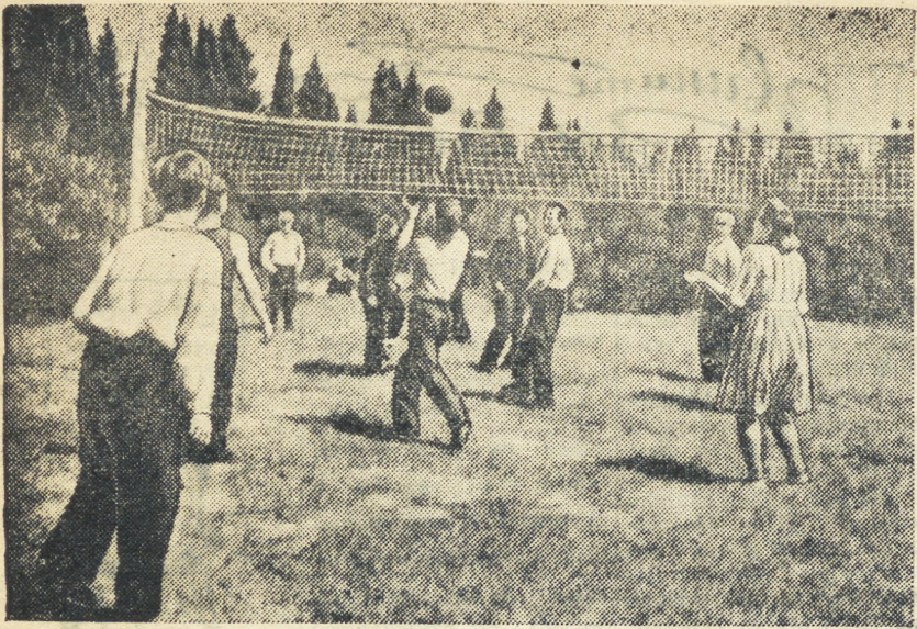
Молодые колхозники артелей «Интернационал» и «За социализм», Ачитского района, часто встречаются на спортивной площадке, устраивают соревнования по различным видам спорта. В день колхозной массовки, посвященной окончанию весенних полевых работ, на площадке составлялись в локести волейбольные команды.