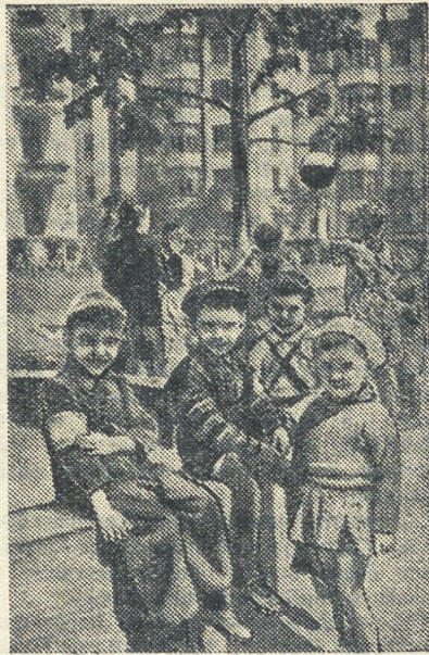
На игровой площадке во дворе дома № 69 по улице Ленина.