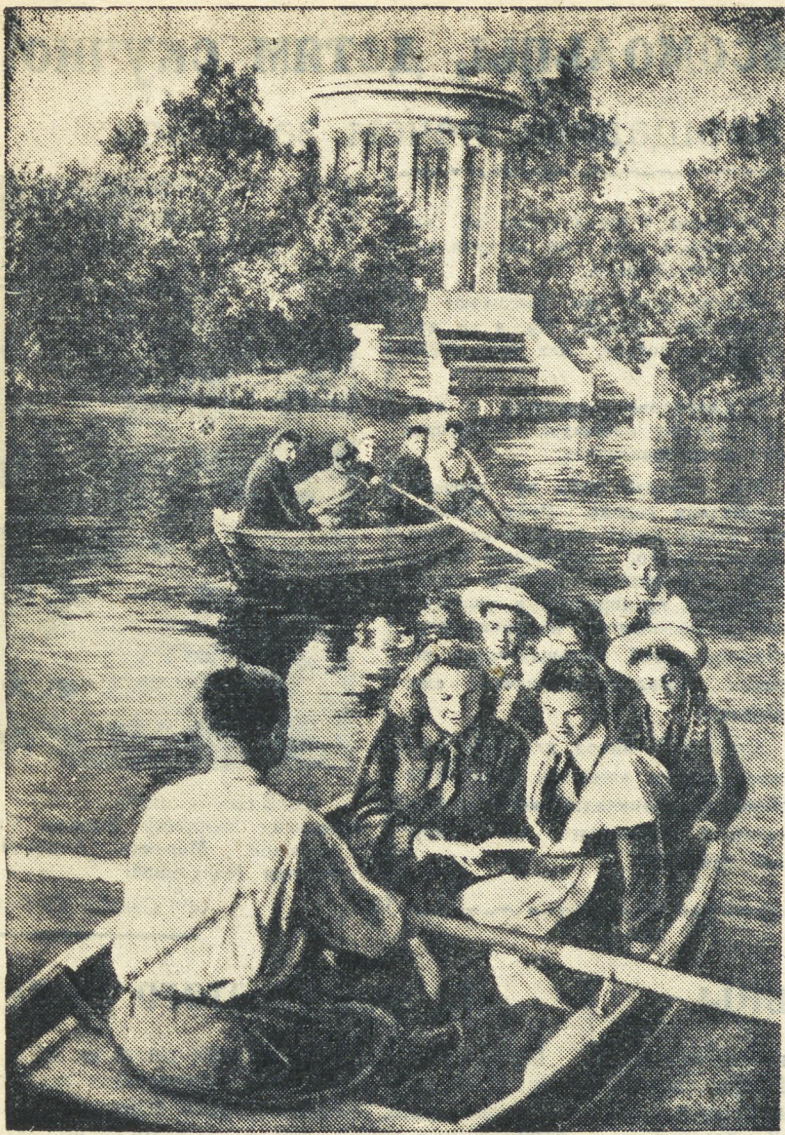
В воскресенье открылся парк свердловского Дворца пионеров. НА СНИМКЕ: катанье на лодках по пруду парка.