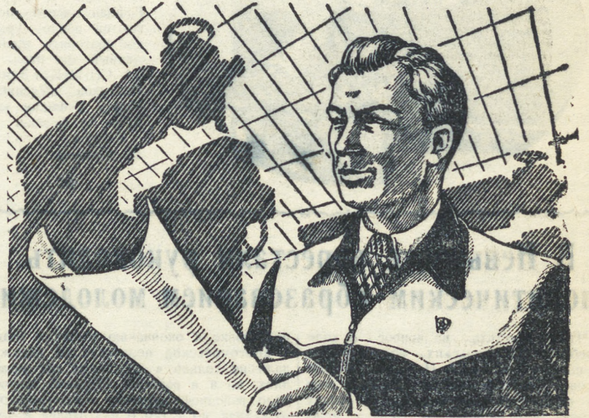
Рис. П. Евладова.

Последние дни практики казались слишком короткими. Нехватало времени. Как-то Владимир зашел в цех уже с наброском приспособления и показал