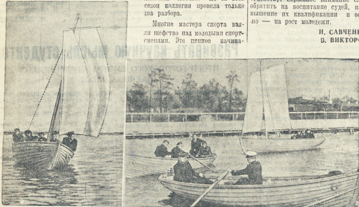
9 мая в честь Дня Победы Свердловский военно-морской клуб произвел спуск на воду гребно-парусных судов. Были проведены первые занятия шлюпочных команд по хождению на веслах и под парусами. НА СНИМКЕ: на Верх-Исетском пруду 9 мая.

Адрес техникума: гор. Свердловск, ул. Малышева, 33-а. Тел. Д1-16-62.