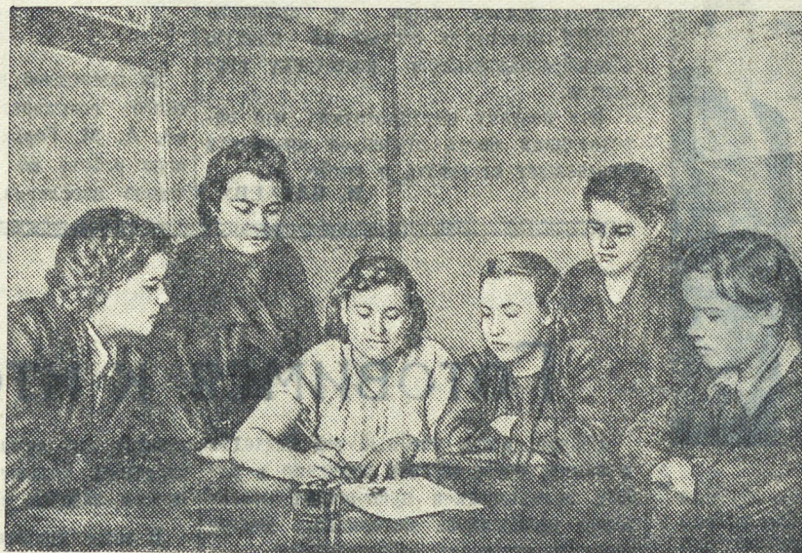
— Пусть и они по-настоящему беспокоятся о выполнении программы, — говорит молодая рабочая, подписывая письмо комсомольцам и молодежи Ярославского шинного завода.

— Три года тому назад я получил свой разряд, — про-