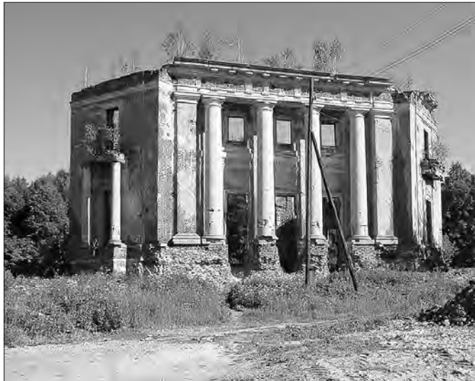
Останки дворца в начале XXI века.