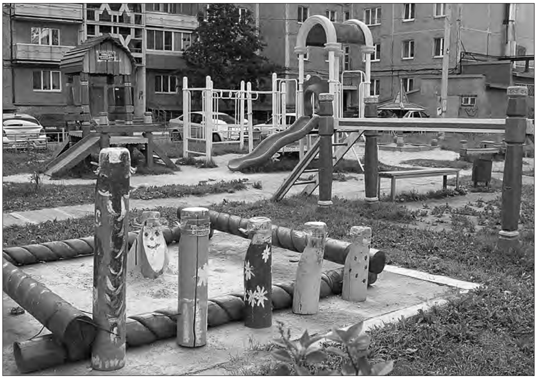
Детская площадка на ул. Космонавтов, 9.

Анастасия ВАСИЛЬЕВА.