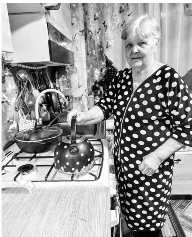
Газ в частном доме – гарантия комфортного быта

Подать заявки на участие в программе социальной догазификации можно через сайт «Госуслуги» или в офисе АО «Регионгаз-инвест» по адресу: улица Логина, 44, телефон: 6-32-42.