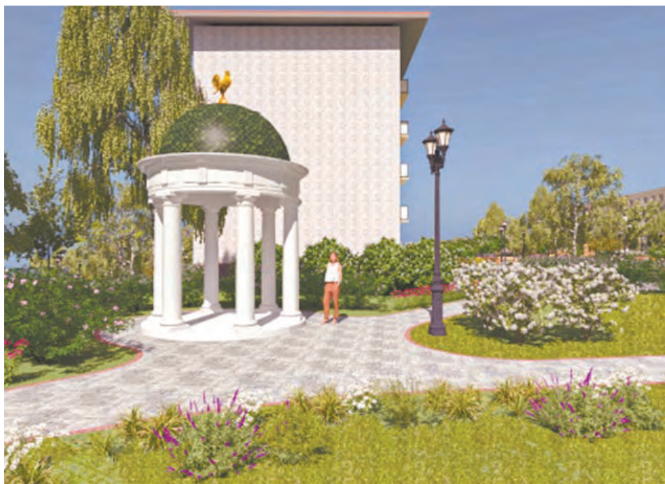
Так будет выглядеть ротонда в благоустроенном сквере на Серебрянке