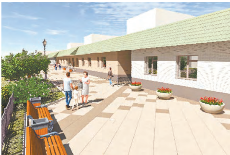
Новый облик четной стороны улицы Елизарьевых