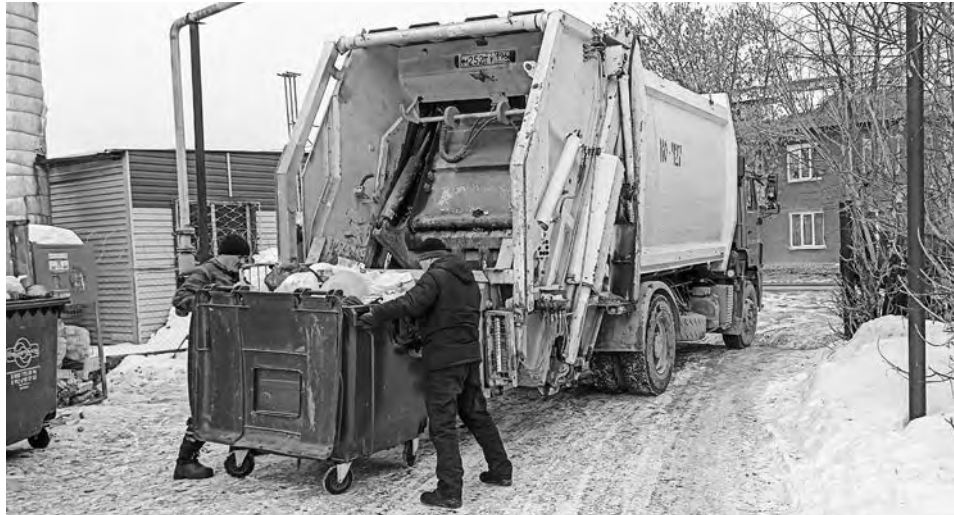
Очистка контейнеров производится по графику в соответствии с санитарными правилами

Как в Ирбите организована уборка контейнерных площадок и какие штрафы ждут жителей за «свинство» на улице