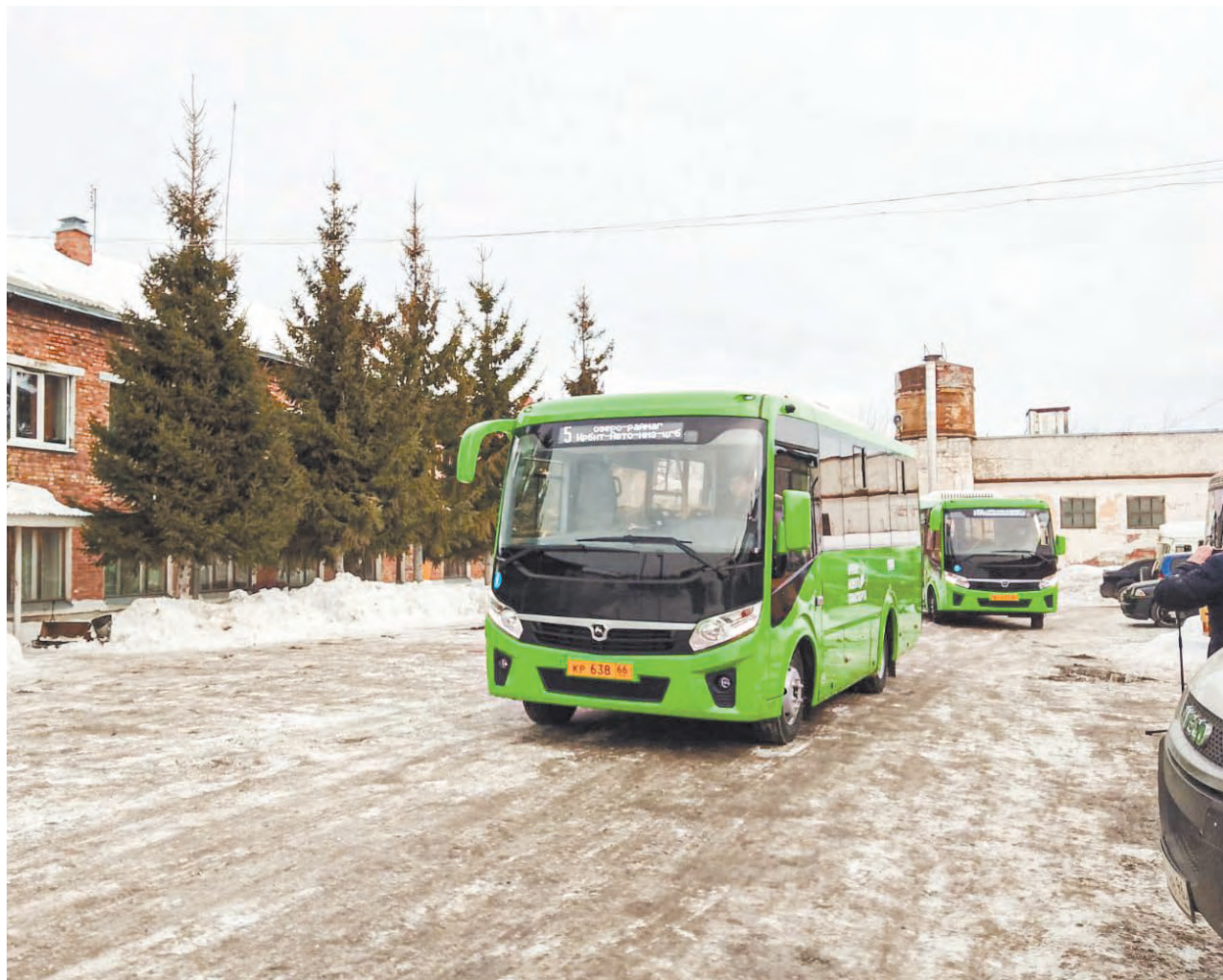
Новые автобусы выезжают на маршруты с предприятия «Ирбит-Авто-Транс»