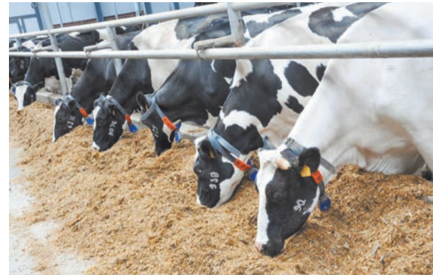
Сельхозкооператив много лет успешно занимается и животноводством, и земледелием