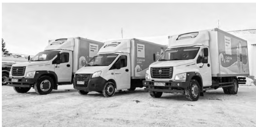
Часть новой партии – автомобили ГАЗель

Нынешнее обновление автопарка можно считать беспрецедентным, отмечают в пресс-службе предприятия. В прошлые года приобреталось максимум по 3-4 единицы техники, в этом году сразу 20! Новые россий-