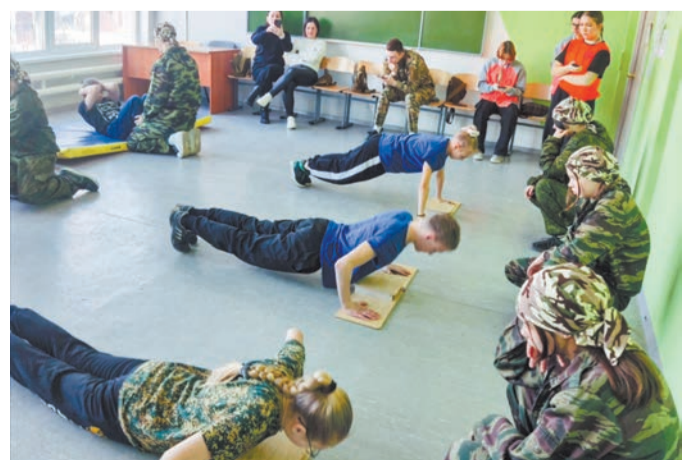
Один из этапов игры – физподготовка

В Ирбите на базе гуманитарного колледжа прошла окружная комплексная военно-патриотическая игра «Доблесть» при поддержке областного министерства образования и молодежной политики. В ней приняли участие 22 команды школьников и студентов с разных территорий Восточного управленческого округа.