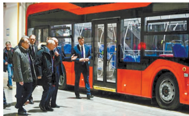
Владимиру Путину показывают новый троллейбус от «Уральских локомотивов»

Напомним, что по поручению президента России с 2022 года по всей стране реализуется федеральная программа модернизации школьных систем образования. Только в Свердловской области за этот период было отремонтировано 48 зданий школ. В 2024 году капремонт будет проводиться в 15 школах, на эти цели направлено свыше миллиарда рублей.