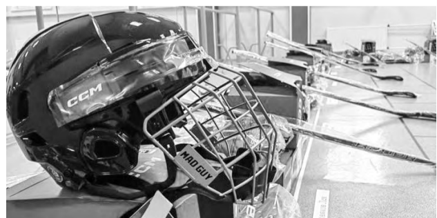
С помощью инициативного бюджетирования муниципалитеты регулярно приобретают экипировку для спортивных команд

Качественно исполненные уральские проекты отмечены на федеральном уровне. Так, в прошлом году победителем Всероссийского конкурса проектов инициативного бюджетирования в номинации «Общественное партнерство» стала детская спортивная площадка «Джунгли» в поселке Верхняя Синячиха Алапаевского района.