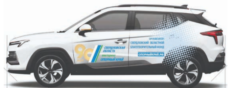
На подарочных «Москвичах» будет юбилейная символика – «90 лет Свердловской области»