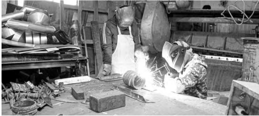
Обучение профессии при опытном наставнике дорогого стоит

По словам авторов обращения, УТЦ никогда не испытывал такого организационного провала и потери