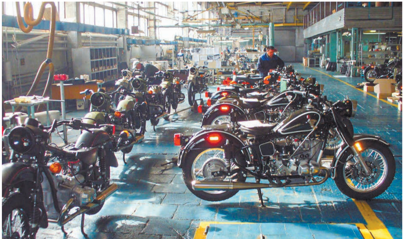
Лимитированную серию мотоциклов для викторины уже собирают на производстве

– Изначально планировалось, что квартир будет 40, машин – 90 и смартфонов – 1000. Но свердловские благотворители с таким воодушевлением отнеслись к идее